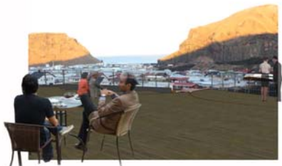
Seð af Lerkipalli hjá kaffihúsi yfir bæinn