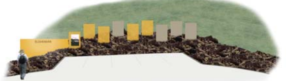
Sýningarveggir / Vindbrjótur