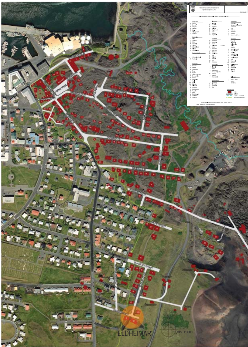
Loftmynd sýnir núv. hús og götur ásamt götum og húsum sem fóru undir hraun í eldgosinu á Heimaey árið 1973. Eldheimar - gosminjasafn er byggt yfir Gerðisbraut 10.