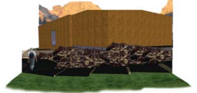
Efrasvæði þar sem hraunrenslí leggst að Eldheimum