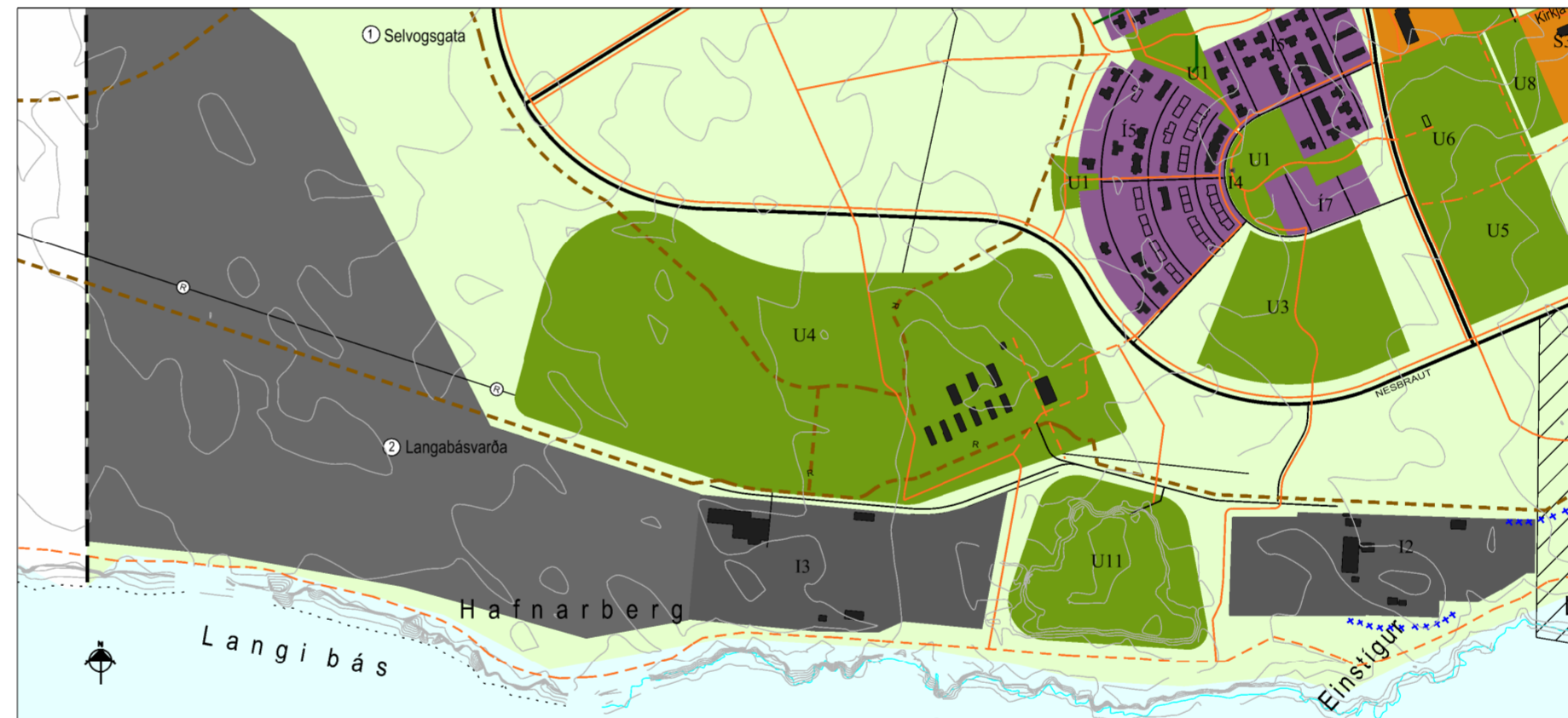
Breyting á aðalskipulagi Ölfuss 2010-2022, þéttbýlisuppráttur mkv. 1:10.000.